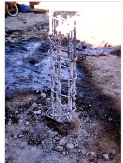
Fig. 3 Micropilote \varnothing 300 mm luego del descabezado.