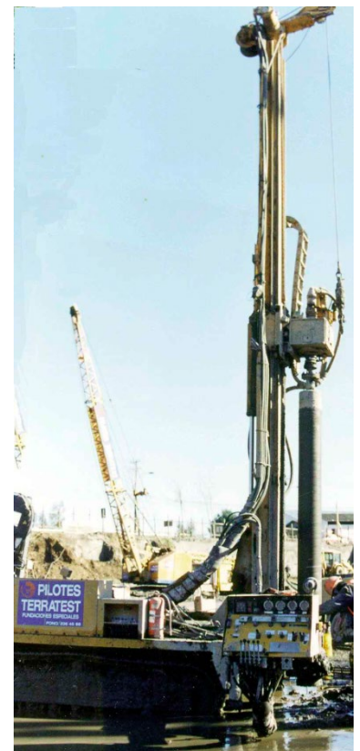
Fig. 4 Perforadora durante la extracción Del casing de micropilotes al terminar el hormigonado.