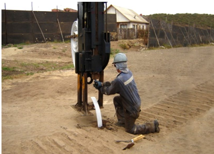
Imagen 1 – Instalación de Mechass Drenantes