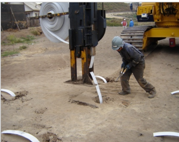
Imagen 3– Detalle instalación Mechas Drenantes.