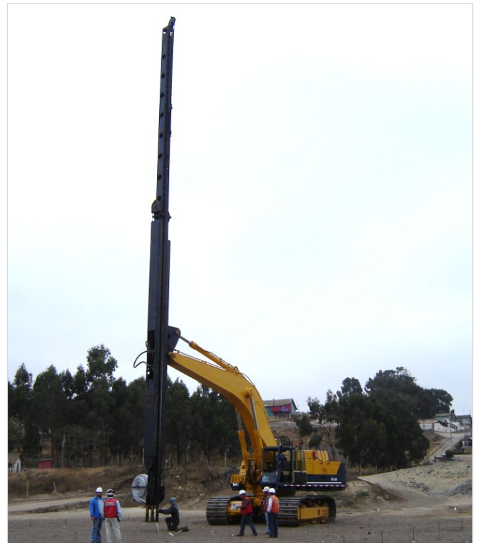
Imagen 2 – Equipo de instalación de Mechass Drenantes