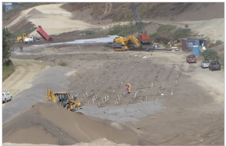
Imagen 4 – Vista general de área de consolidación.