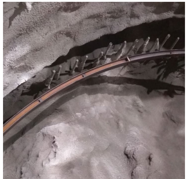
Vista de los paraguas ya instalados.