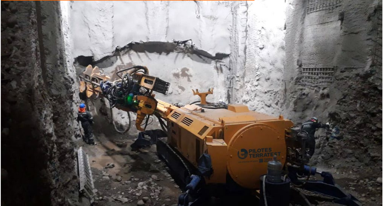
Perforadora para túneles con mástil corto.