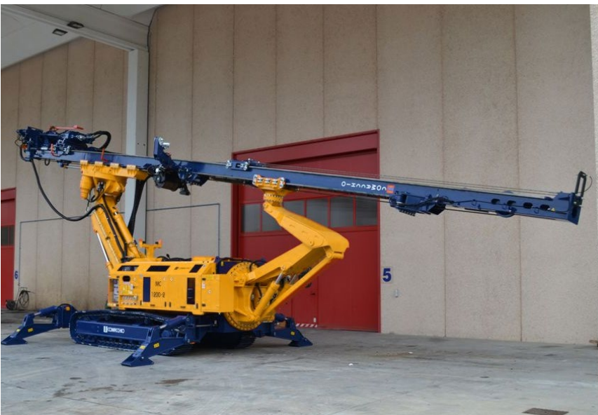
Perforadora para túneles con mástil largo.